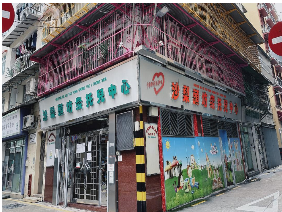
沙梨頭坊眾托兒中心